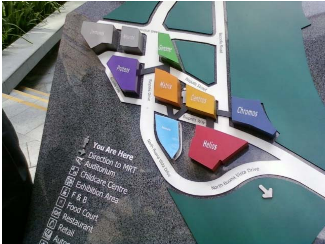
< 바이오 폴리스 안내도 >