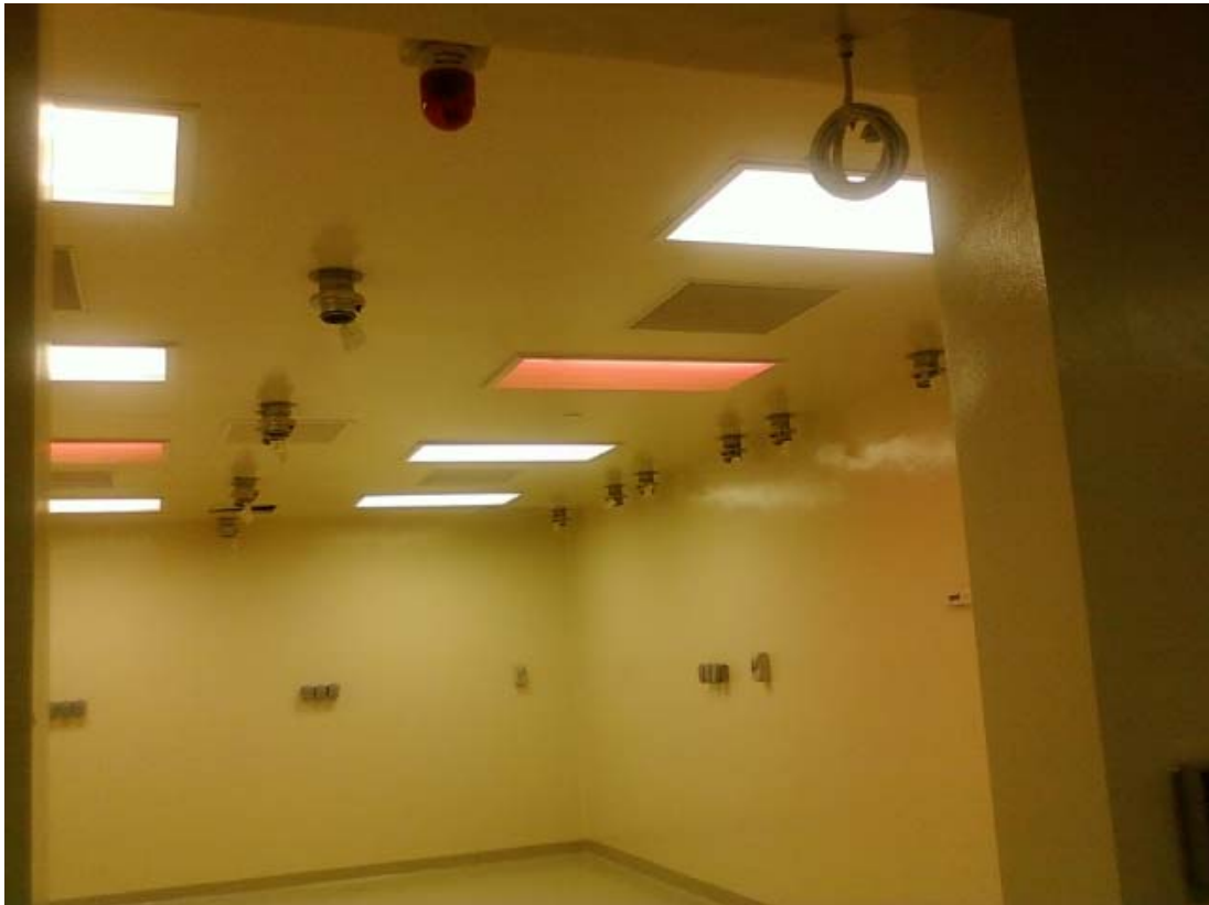
< MVCS RACK 천정 연결 배기관 >