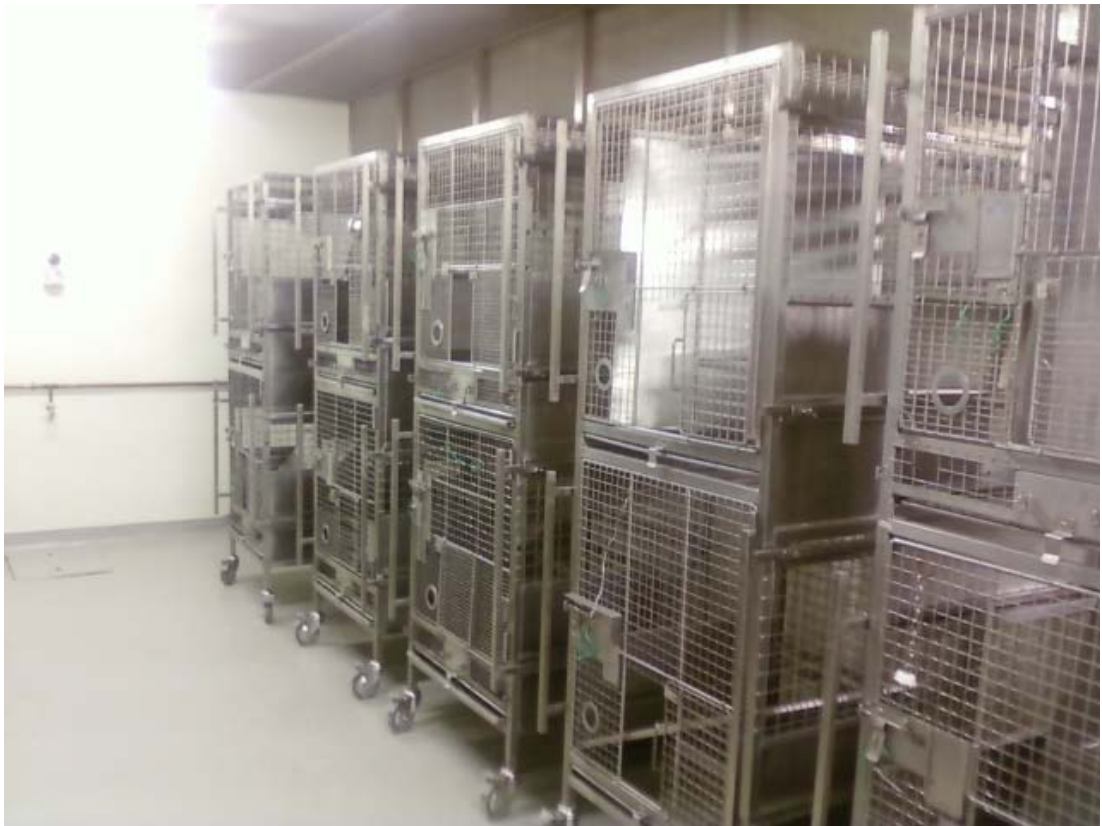
< 정부기관 원숭이 사육장 >