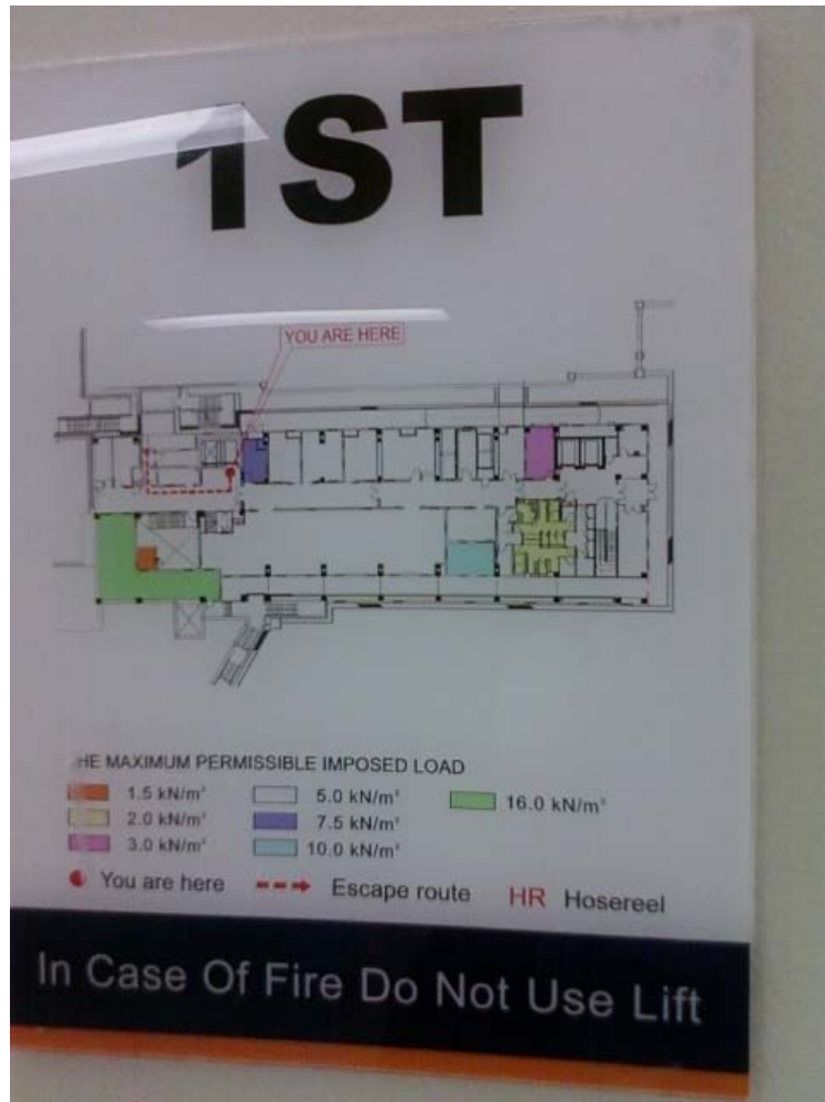
< 싱가포르 의과대학 실험동물실 1층 >