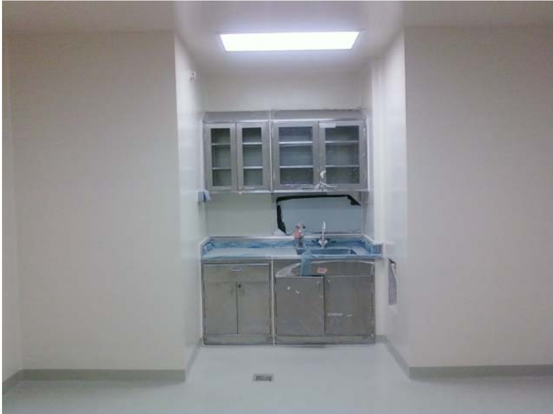
< 붙박이형 싱크 테이블 >