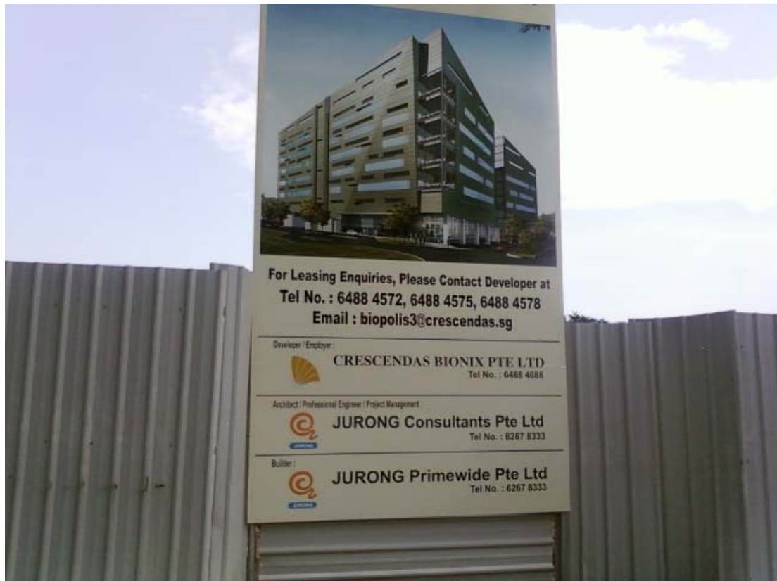
< 바이오 폴리스 2단지 조감도 >